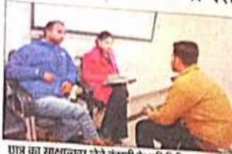
छात्र का साक्षात्कार लेने कंपनी के प्रतिनिधि। अमर उजाला

रोहतक। श्री लालनाथ हिंदू कॉलेज में कैरियर गाइडेंस एवं प्लेसमेंट सेल के तत्वाधान में कैरियर इन इश्योरेंस सेक्टर विषय पर विस्तार व्याख्यान का आयोजन किया गया। यहां