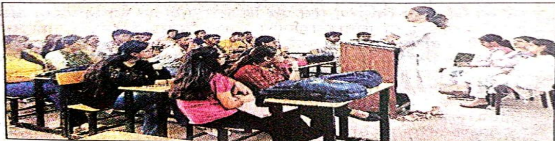
कार्यक्रम में उपस्थित विद्यार्थी।